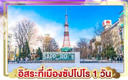
อิสระที่เมืองซัปโปโร 1 วัน