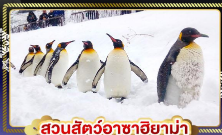
สวนสัตว์อาซาฮิยาม่า