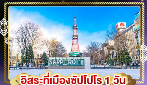
อิสระที่เมืองซัปโปโร 1 วัน