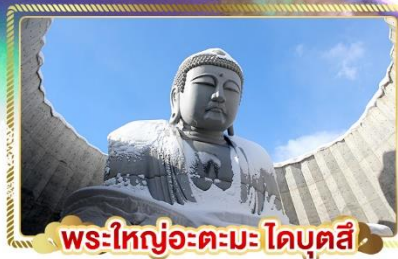
พระใหญ่อะตะมะโดบุตสึ